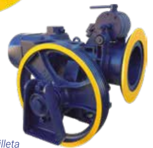
Disponible con silleta